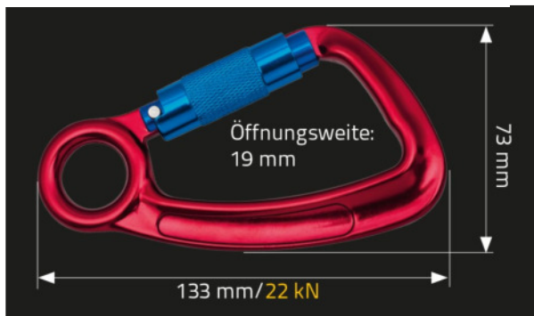
Abbildung zeigt MAS 52 illustration shows MAS 52

gepr. nach EN 362:2004, KL. B tested according to: