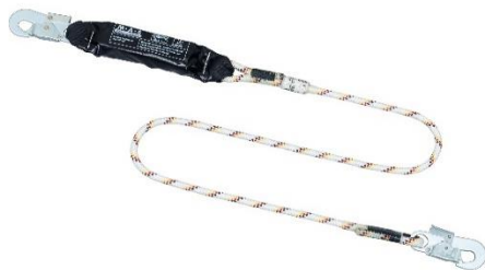
Abb.: Tyger 6 mit Haken MAS 51