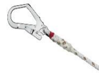
Haken MAS 50