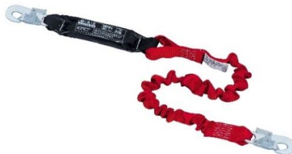
Abb.: Tyger FlexBelt mit Haken MAS 51