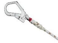
Haken MAS 50