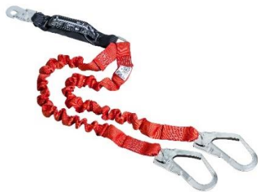
Abb.: Tyger FlexBelt-Twin mit Haken MAS 51