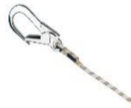
Haken MAS 65